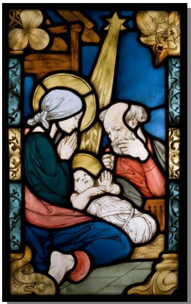
Stanisław Wyspiański, Józef Mehoffer: Narodzenie Pańskie

Pismo Parafii pw. NMP z Lourdes w Krakowie ♦ nr 1 (177) ♦ styczeń 2017 r.