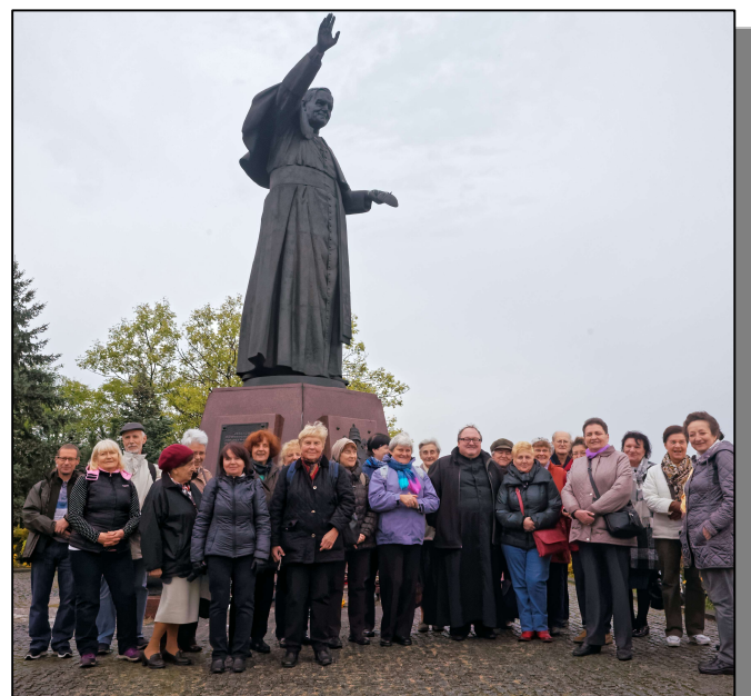
Nasi pielgrzymi na wałach jasnogórskich

Po krótkiej przerwie na gorącą herbatę i kawę (pogoda była „w kratkę”, trochę padało i wiał wiatr) – pojechaliśmy do Parku Miniatur Sakralnych. ➡