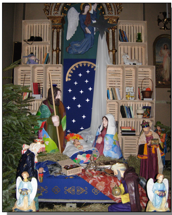
Ubiegłoroczna szopka w naszym kościele

Wszystkim Czytelnikom życzymy radosnego świętowania spotkania z Panem podczas świąt Bożego Narodzenia! Z sercami oczyszczonymi przez pokutę! Skoro błogosławieni czystego serca, albowiem oni Boga oglądać będą (Mt 5, 8) –