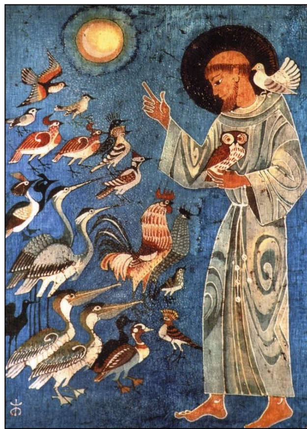
Na ilustracji: Św. Franciszek głosi kazanie do ptaków

O zmartwychwstaniu umarłych i sądzie ostatecznym, odnowionym świecie i nowym życiu w tym świecie wszystkich, którzy należą do Jezusa – czytamy w Apokalipsie : I ujrzałem umarłych – wielkich i małych – stojących przed tronem, a otwarto księgi . (...) I osądzono zmarłych z tego, co w księgach zapisano, według ich czynów (Ap 20, 12). I dalej: I ujrzałem niebo nowe i ziemię nową (...). I Miasto Święte – Jeruzalem Nowe ujrzałem zstępujące z nieba od Boga (...). I usłyszałem donośny głos mówiący od tronu: Oto przybytek Boga z ludźmi: i zamieszka wraz z nimi, i będą oni Jego ludem, a On będzie „BOGIEM Z NIMI”. I otrze z ich oczu wszelką łzę, a śmierci już odtąd nie będzie (...). I rzekł Zasiadający na