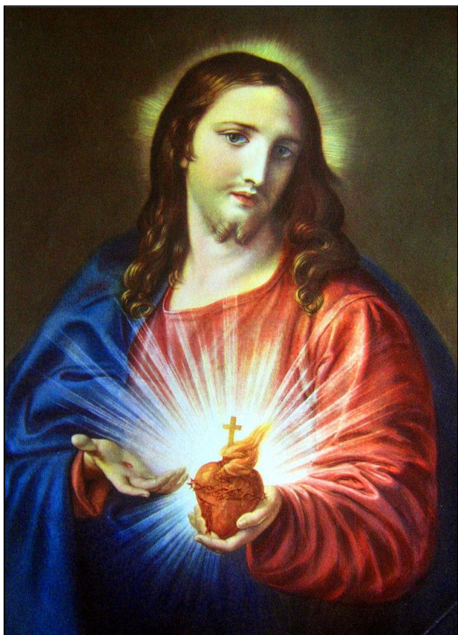
Pompeo Batoni (1708-1787), Serce Jezusa

Pismo Parafii pw. NMP z Lourdes w Krakowie ♦ nr 6 (266) ♦ czerwiec 2024 r.