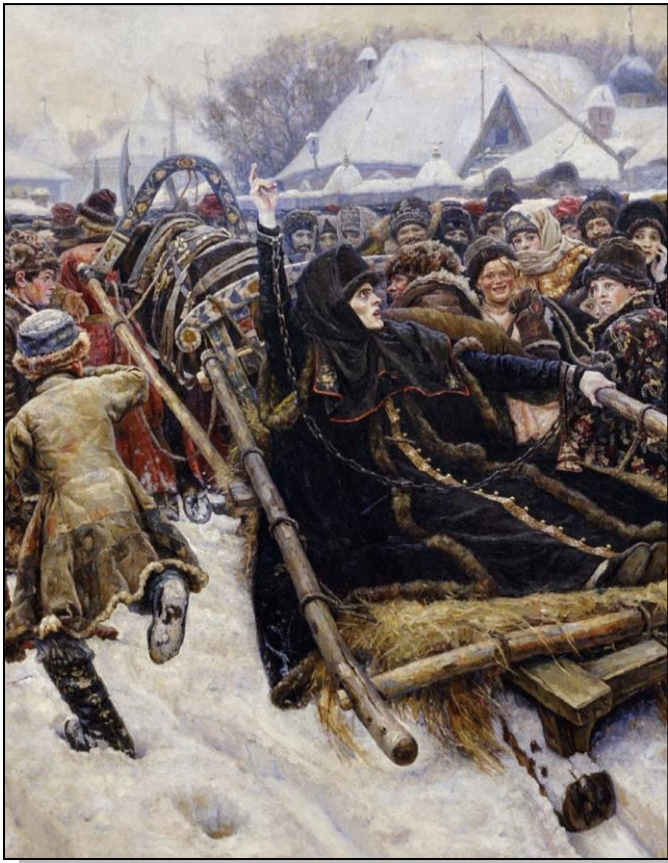
Na ilustracji: Wasilij Surikow, Bojarynia Morozowa (fragment)