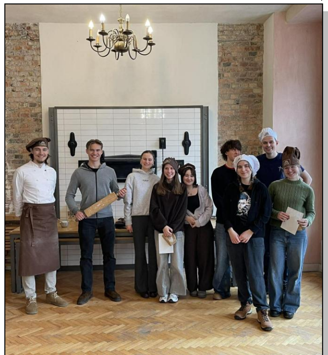
Na zdjęciu: Na warsztatach historyczno-kulinarnych w Rogalowym Muzeum Poznania

Sobota przebiegła pod znakiem silentium: cisza na posiłkach, cisza na korytarzach. Plan dnia był taki sam, jak w piątek, a księża tego dnia zaproponowali nam nietrywny temat miłości do siebie samego, czyli samoakceptacji. Refleksje na spotkaniach grupowych były tego dnia jeszcze bardziej osobiste, a o dobrą i bezpieczną atmosferę starali się animatorzy. Był to 14. dzień lutego, stąd rozważania o miłości były jak najbardziej „na czasie”. Osobiście było mi bardzo trudno wytrwać w ciszy, która miała trwać aż do niedzielnego poranka – jednak udało się! Pragnę teraz opowiedzieć o moim doświadczeniu z